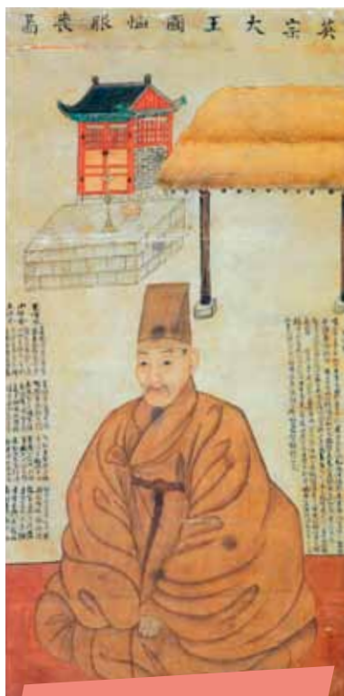
Dostojnik yangban z końca XVIII wieku. System feudalny prawdopodobnie przyczynił się do pogłębienia kultury jeong .

ju oznaczały, że ludzie musieli trzymać się razem i troszczyć o interes wspólny, a nie tylko własny. Do tego należy jeszcze dodać status Korei jako pionka w grze o władzę, którą prowadzili jej potężniejsi sąsiedzi – Chiny i Japonia. Konieczność walki o przetrwanie własnego narodu sprawiła,