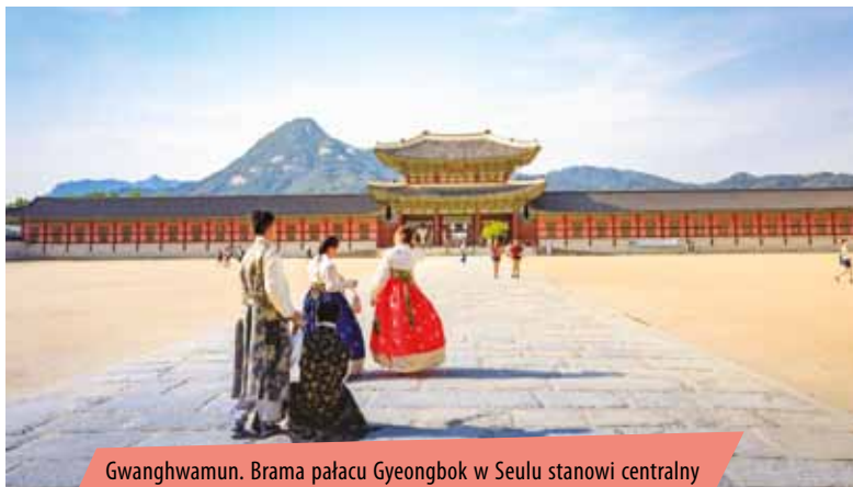
Gwanghwamun. Brama pałacu Gyeongbok w Seulu stanowi centralny punkt całego kraju. Podobno przez tę bramę przepływa gi (energia) narodu.

nym wiedzy światowy prym pod względem liczby samobójstw i operacji plastycznych oraz wysokości sum wydawanych na towary luksusowe. I właśnie w tym kraju jest też chyba najwięcej na świecie zestresowanych i przeciążonych nauką uczniów. Wszystko to wynika z głęboko zakorzenionej w koreańskiej kulturze rywalizacji, która sprawia, że zwykła uroda, umiarkowany dostatek i dobre wykształcenie nie wystarczą. Trzeba konkurować z innymi, dowieść, że jest się najpiękniejszym, najbogatszym i najlepiej wykształconym.