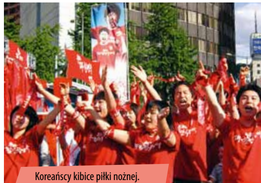
Koreańscy kibice piłki nożnej.

Pierwszy raz postawiłem stopę w Korei w dniu, kiedy drużyna narodowa grała z Włochami podczas Mistrzostw Świata w Piłce Nożnej w 2002 roku. Ponad 15 godzin spędziliśmy w podróży, na którą składały się dwa przeloty samolotem i przeprawa samochodem przez wyboiste wybrzeże z Busanu do przemysłowego