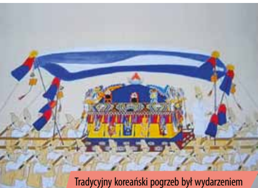
Tradycyjny koreański pogrzeb był wydarzeniem hałaśliwym, barwnym i pełnym han-puri .

w tak krótkim czasie, wciąż postrzegają swój kraj jako tragiczną ofiarę. Odzwierciedla to koreańska sztuka: w najpopularniejszych balladach, serialach telewizyjnych i filmach pobrzmiewa mocno melancholijna nuta han .