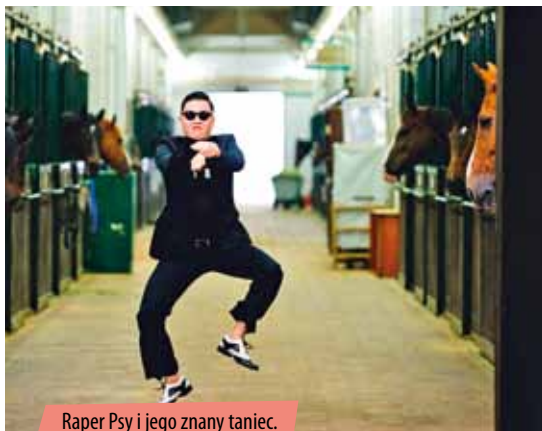
Raper Psy i jego znany taniec.

Choć jednak koreański hipster niekoniecznie chce zostać „Samsung-