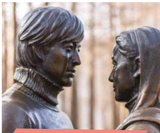
Bae Yong-joon – pomnik aktora na wyspie Nami.

w całej Azji witane są koreańskie gwiazdy, zwane „idolami”, dorównuje beatlemani, a aktorów takich jak Bae Yong-joon wielbią całe rzesze japońskich gospodyń domowych. Post na blogu krytykujący najnowszy singiel popularnego zespołu k-popowego wzbudzi u fanów na drugim końcu świata taką wściekłość, jaką sam zwykle rezerwuję dla kogoś, kto właśnie strasznie obraził moją matkę.